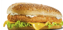
Le Long CHICKEN