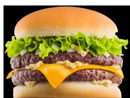
Le Giant Max