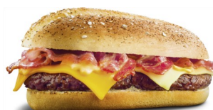
Le Long BACON